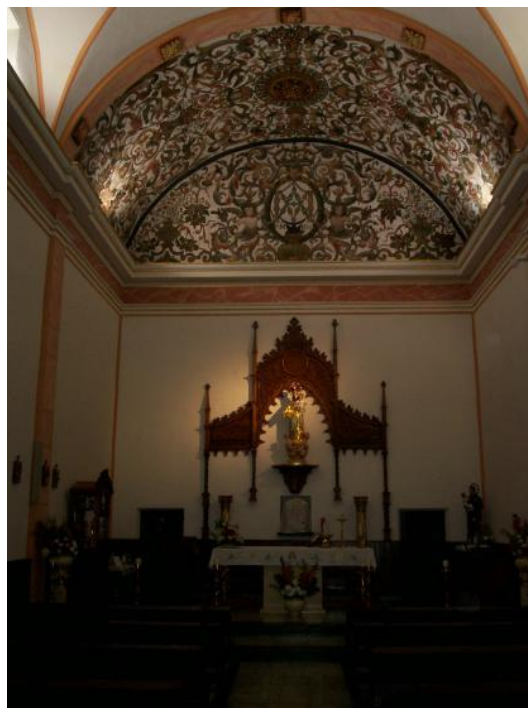
Interior de la Iglesia