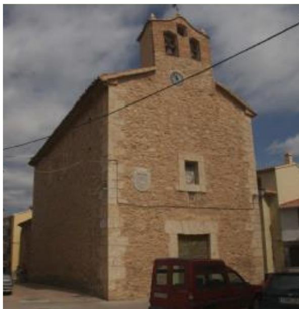
Exterior de la Iglesia