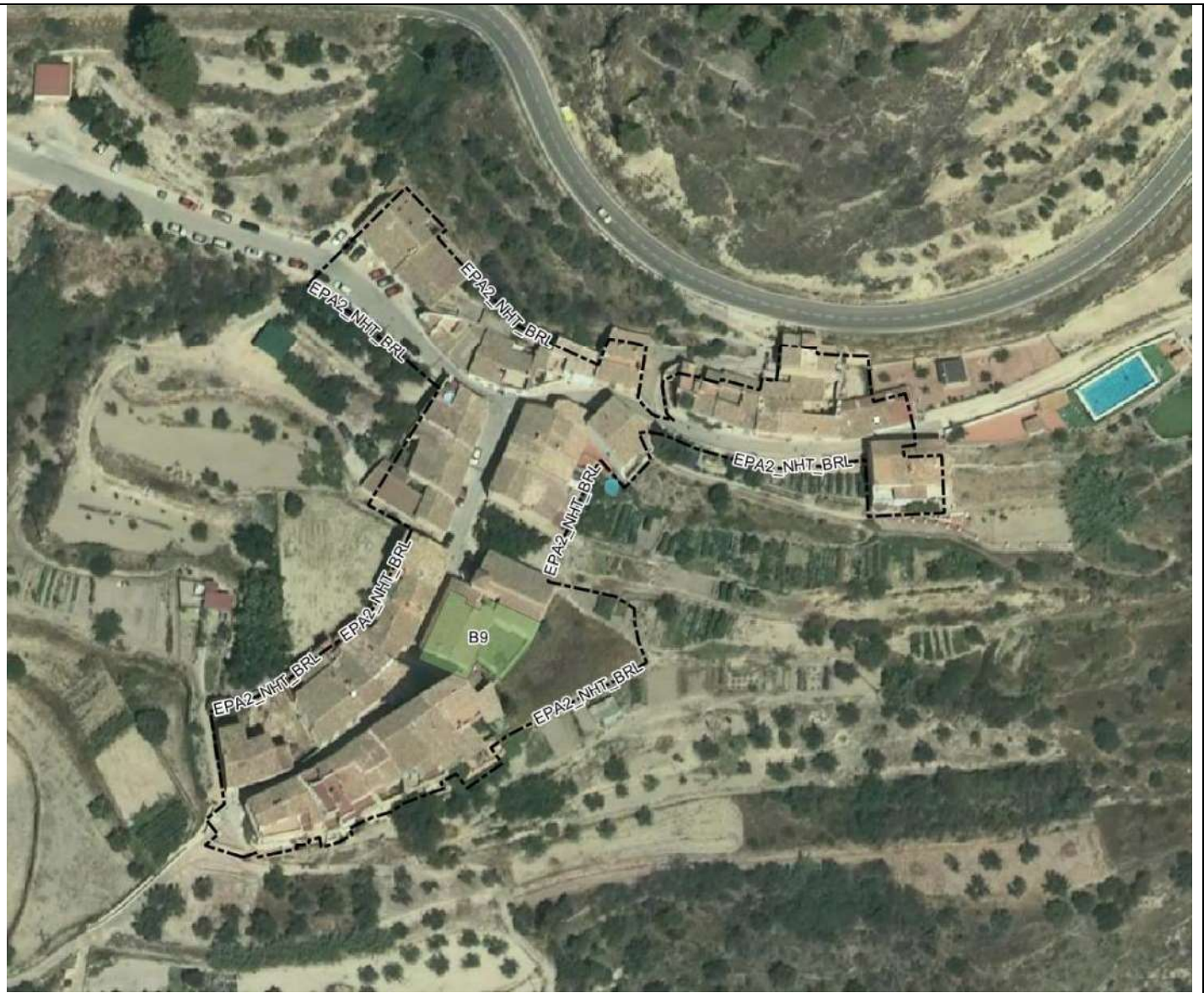
Ubicación palacio de Ares (B9) y entorno de protección que se le aplica (EPA2_NHT-BRL de Ares del Bosque). Escala aproximativa 1:800. Base ortofoto IGN