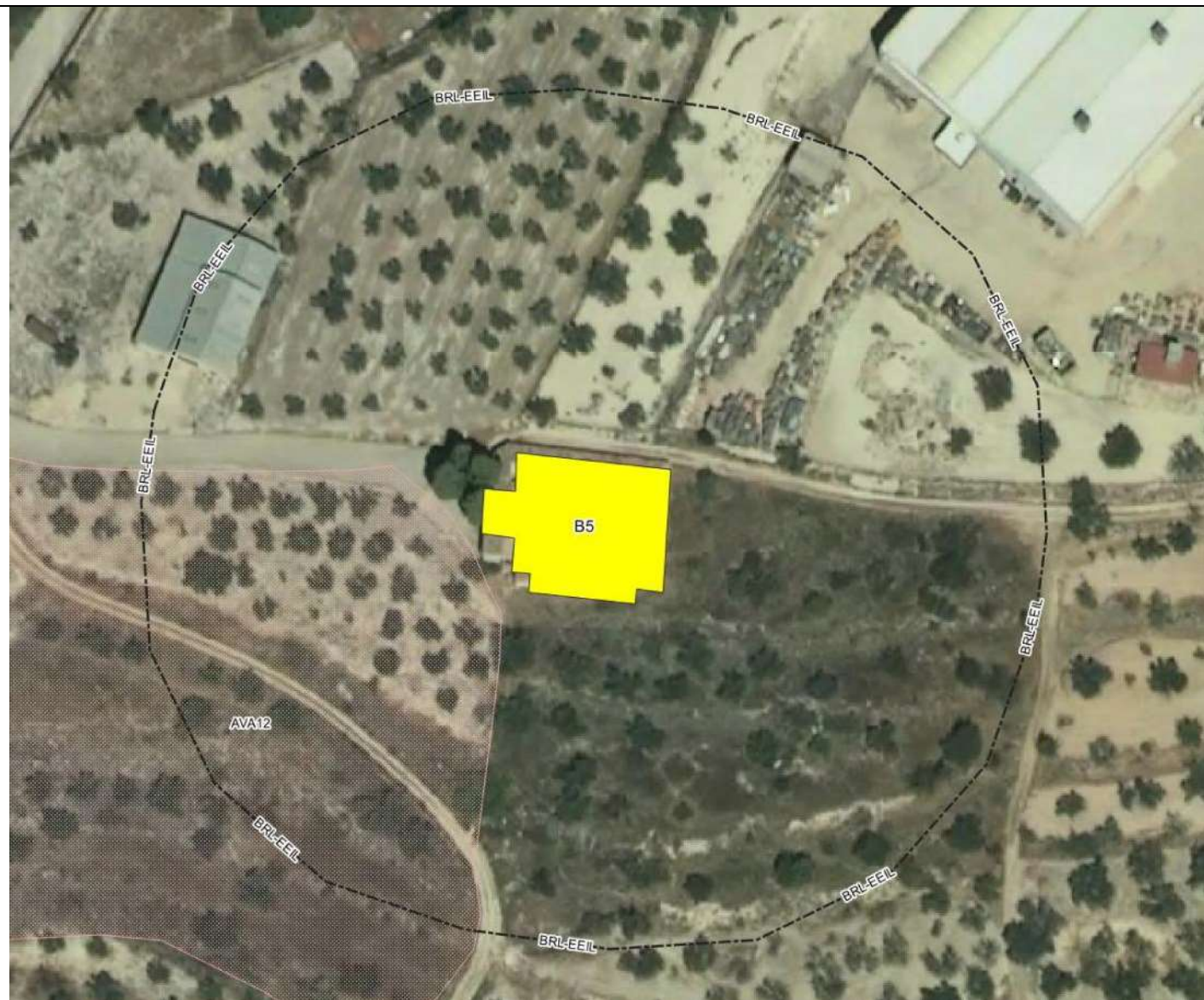
Ubicación Cementerio de Benasau y su entorno de protección. Obsérvese que parte de su entorno, en la zona sureste, está afectado por el Área de protección Arqueológica 12. Escala 1:500. Base cartográfica IGN