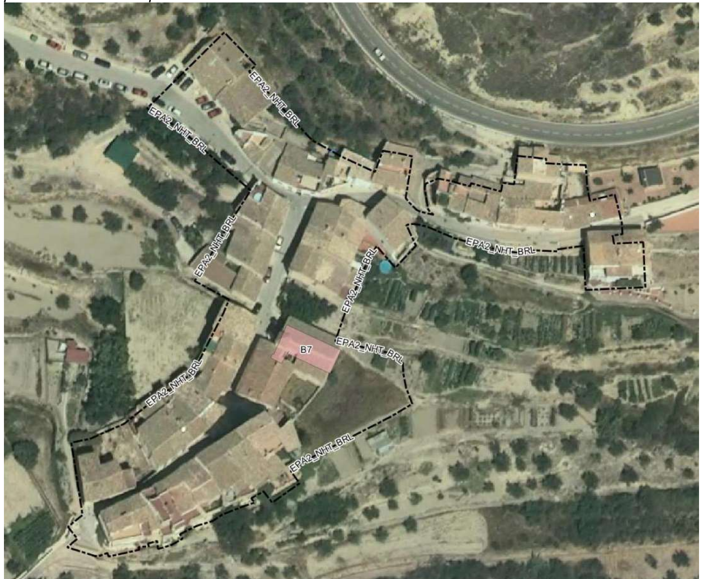
Ubicación de la iglesia parroquial NN.SS. de los Ángeles (B7) y entorno de protección que se le

“En estos ámbitos, el Ayuntamiento velará por que se respeten los tipos edificatorios tradicionales, así como el cromatismo, materiales y disposición de huecos cuando se trate de zonas urbanas y garantizará la preservación del paisaje rural tradicional cuando se trate de ámbitos rústicos, evitándose en todo caso que la situación o dimensiones de las edificaciones o instalaciones perturben su contemplación.”