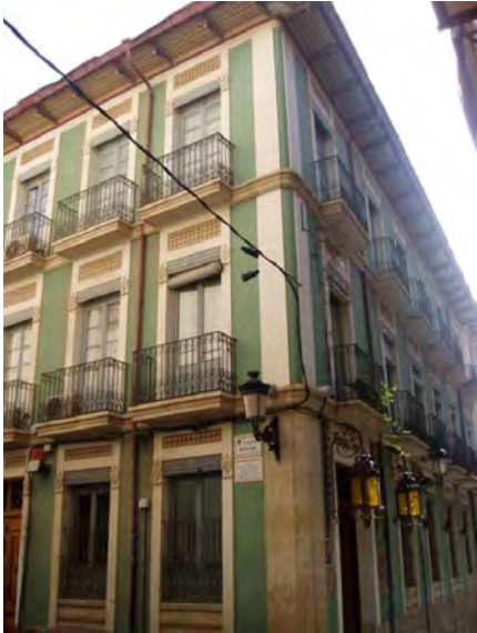
1. Vista general de las fachadas desde la Calle San