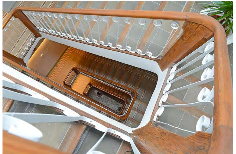
2. Escalera interior.