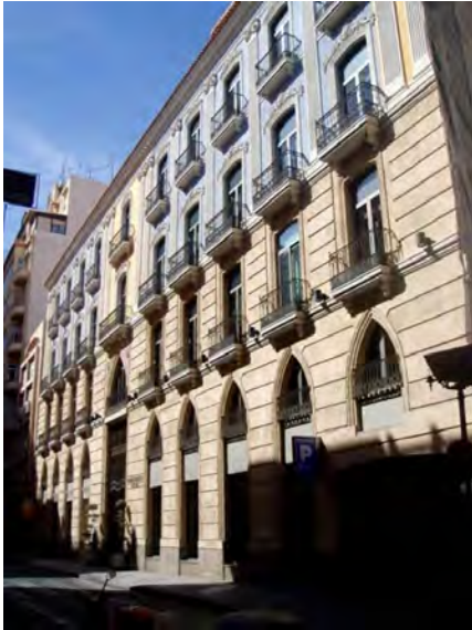
1. Vista general de la fachada principal.