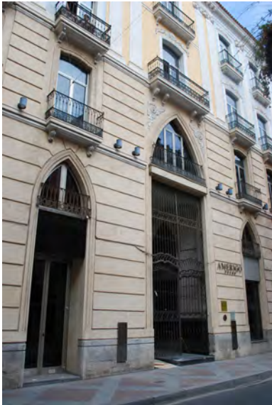
3. Vista de la fachada