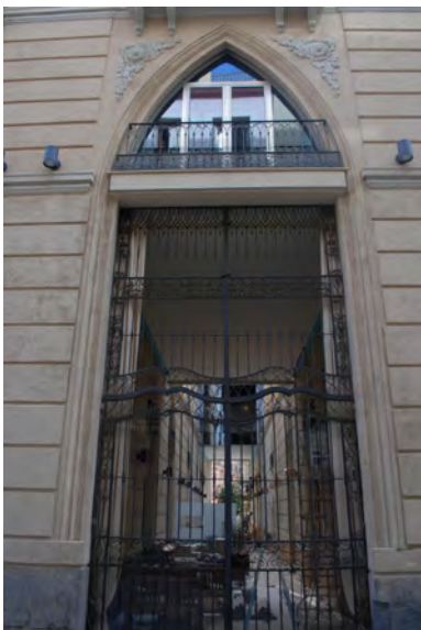
5. Acceso a pasaje.