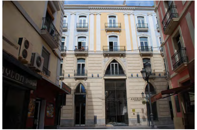
2. Vista de la fachada principal.