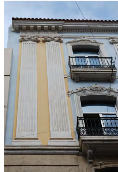
4. Pilastras y alero en fachada.