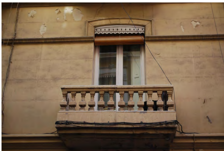
7. Balcón en fachada posterior.