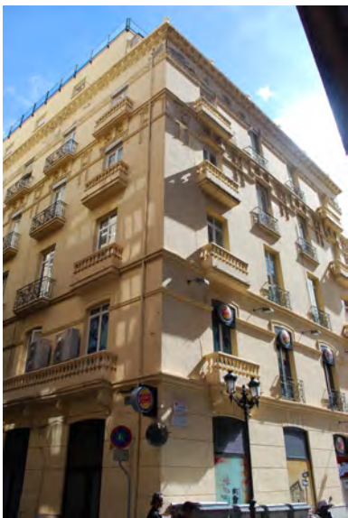
3. Vista de las fachadas lateral y posterior.