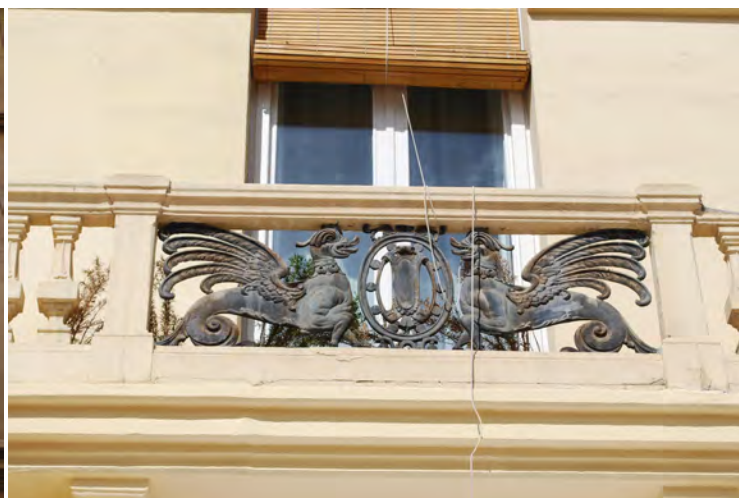
8. Balcón en fachada principal.