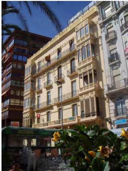
1. Vista general de la fachada principal.