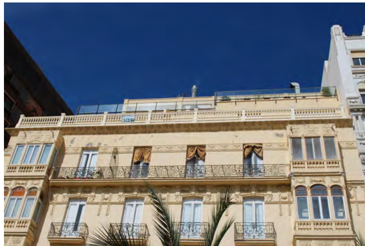
4. Vista de la coronación de la fachada principal.