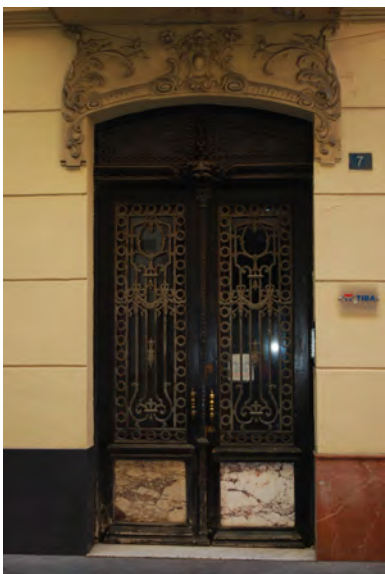
5. Acceso en fachada posterior.