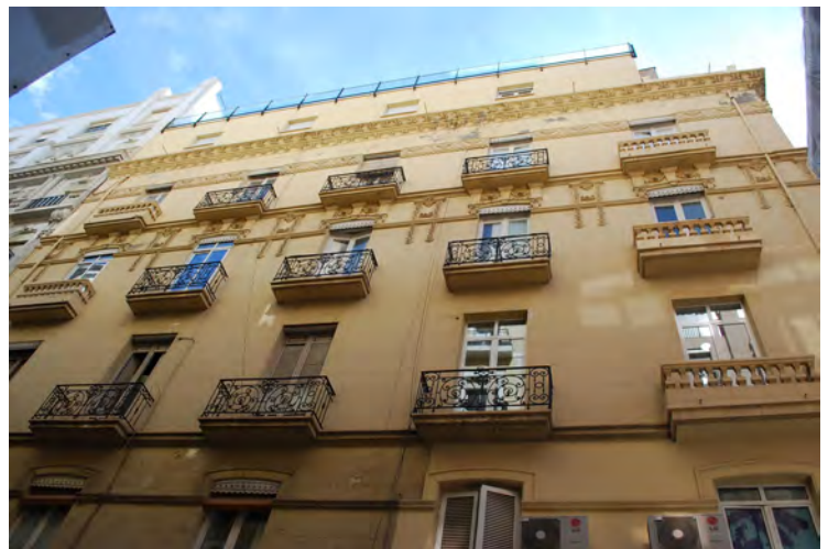
2. Vista de la fachada lateral.