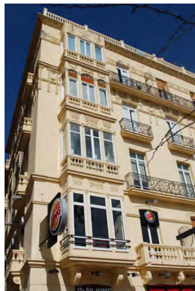
6. Mirador en fachada principal.