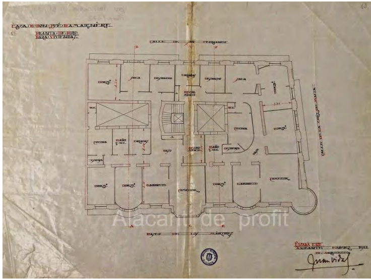
2. Planta tipo de proyecto.