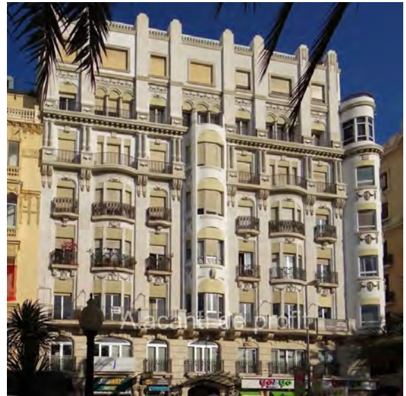
4. Vista de la fachada desde la Explanada.