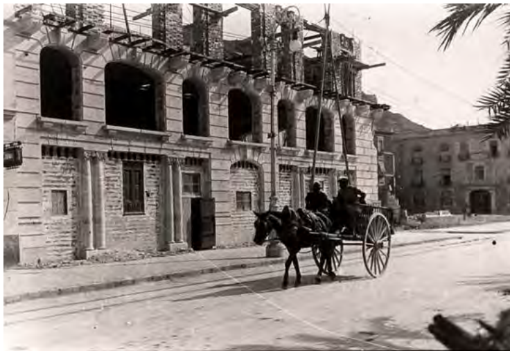
5. Vista histórica durante construcción.