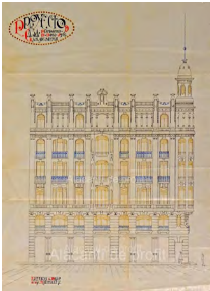
1. Vista en alzado de proyecto.