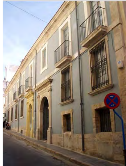
3. Fachada desde la Calle Mayor.