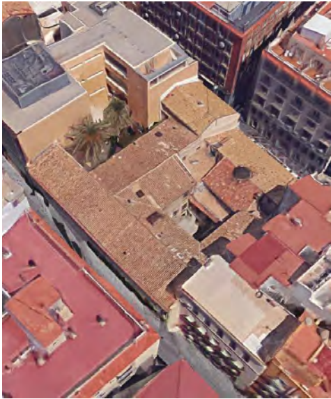
1. Vista aérea