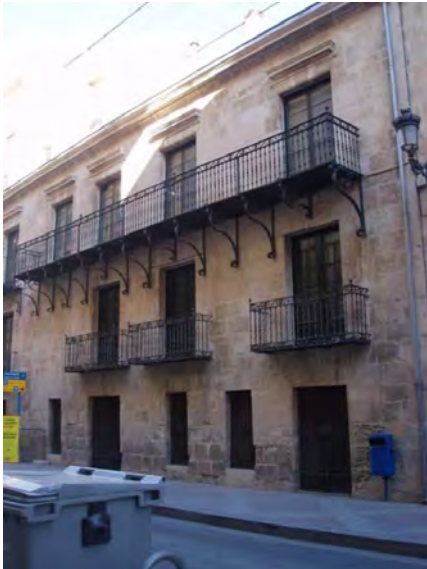
2. Fachada desde la Calle Jorge Juan.