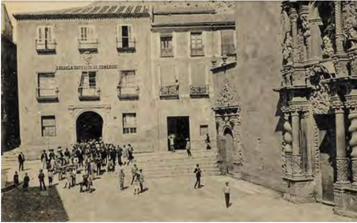
4. Vista histórica de la fachada principal.