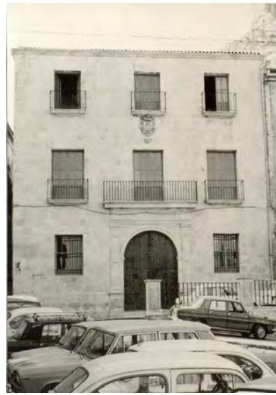
5. Vista histórica de la fachada principal.