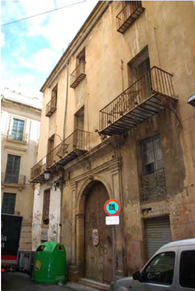
2. Vista de la fachada desde la Calle Miguel Soler previa