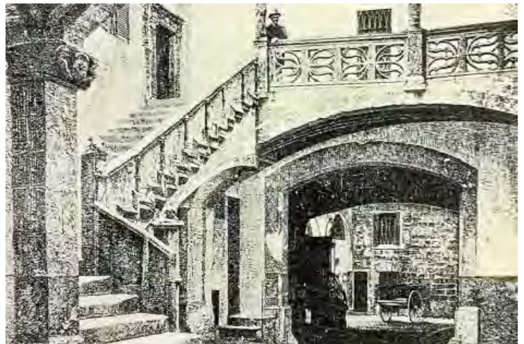
3. Vista histórica del vestíbulo de acceso.