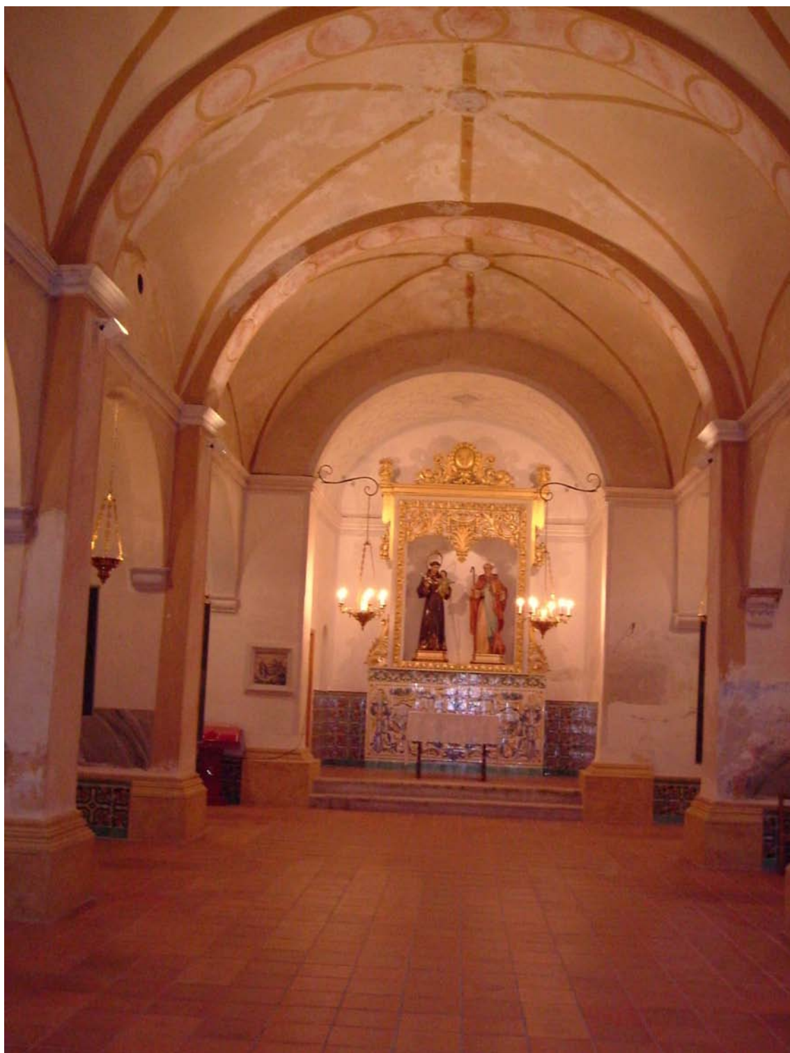
Ermita de Sant Antoni. Interior