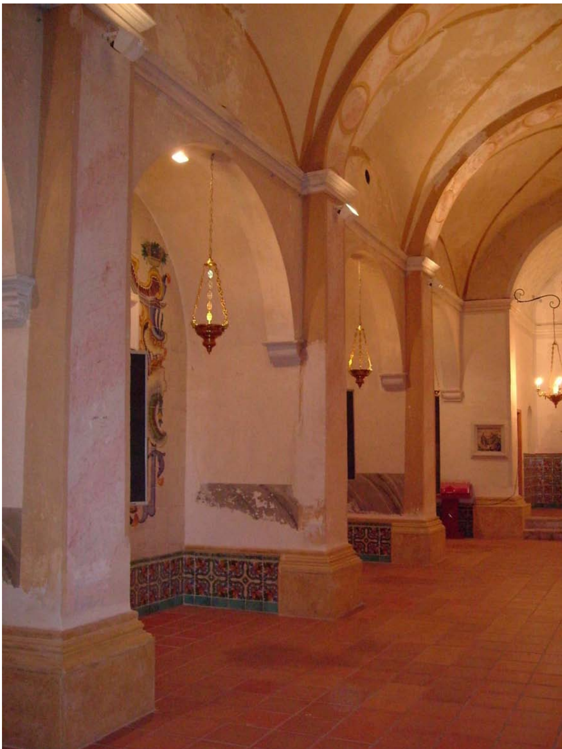
Ermita de Sant Antoni. Capelles laterals