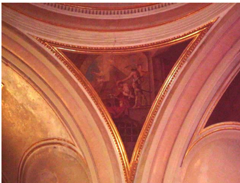
Pintures de la petxina, atribuïdes a l'escola de Miguel de Parra.