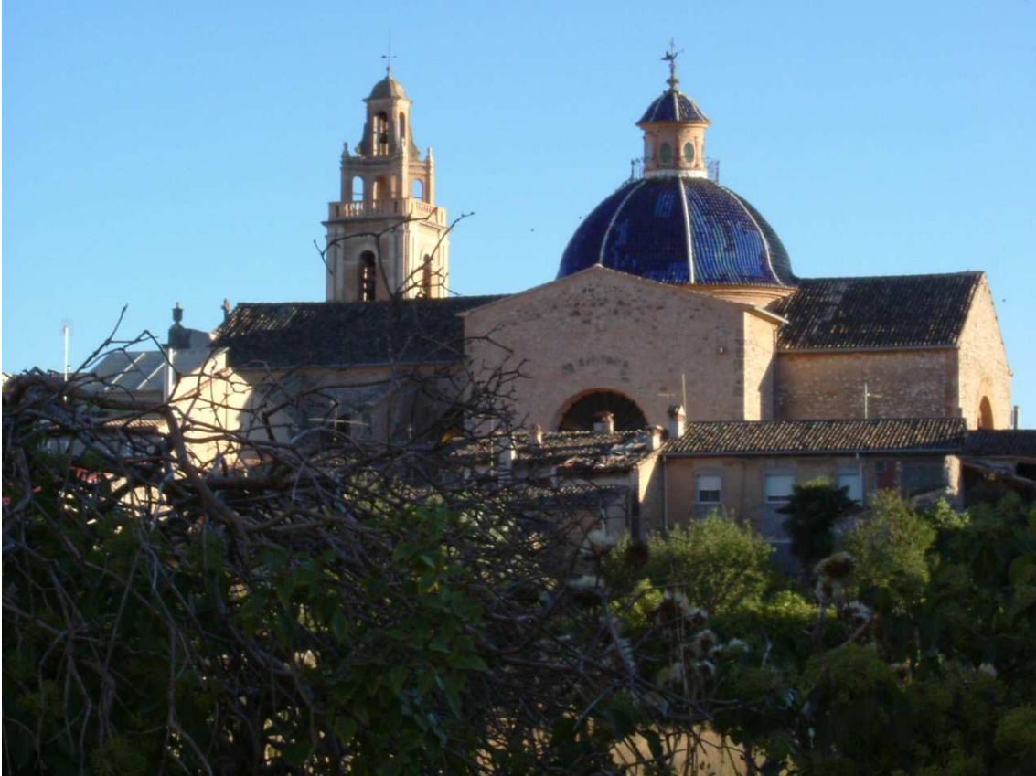
Exterior de l'església. Detall de la cúpula recoberta de taulellets blaus amb el tambor i el campanar.