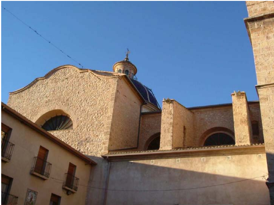
Exterior de l'església. Contraforts que suporten la coberta de la nau central. Cos del creuer.