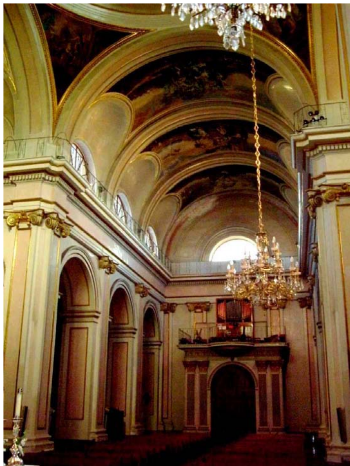
Interior de l'església. Volta de la nau central. Pilastres, motlures i ordre jònic