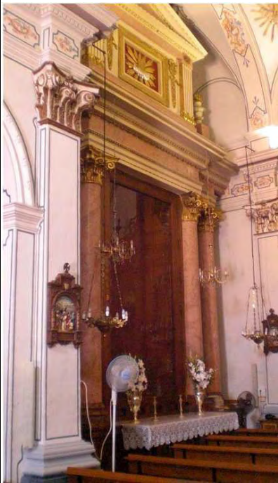
Retablo cerámico Santo Cristo