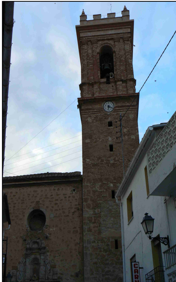
TORRE DEL CAMPANARIO