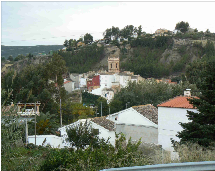
CASCO URBANO Y CAMPANARIO