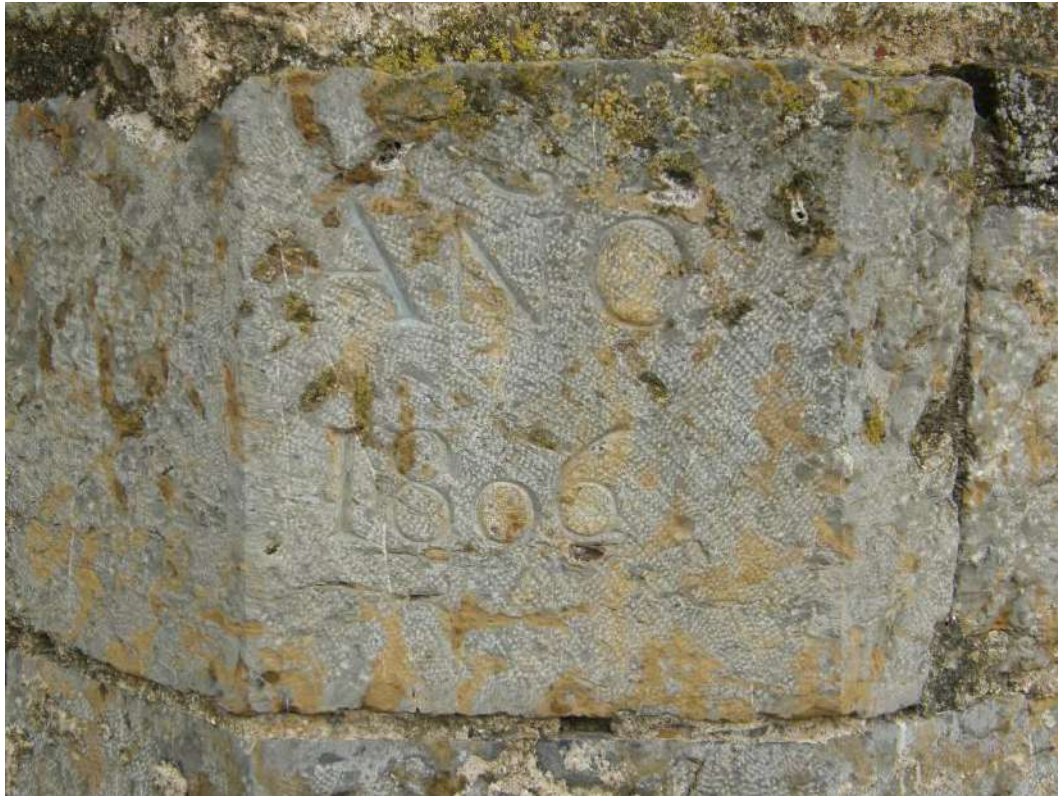
Detalle de la decoración de una capilla, de las lesiones por humedad existentes en el arranque de los muros de fábrica (con daños importantes en la pintura) y de la fecha inscrita en una piedra exterior, correspondiente a la última ampliación