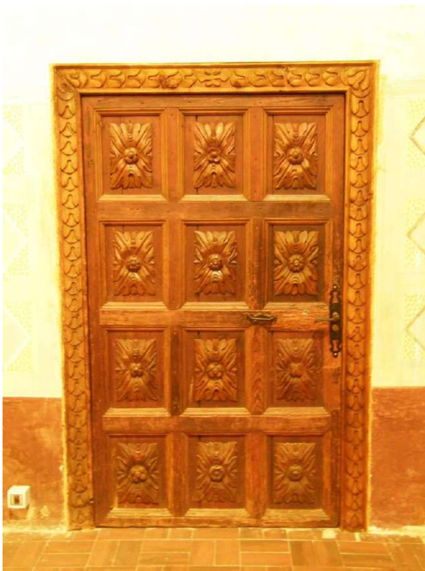
Detalle de la maquinaria del reloj del campanario, en admirable estado de conservación. En la fotografía inferior puede apreciarse el trabajo de carpintería de las puertas de la capilla situada a la izquierda de la nave central