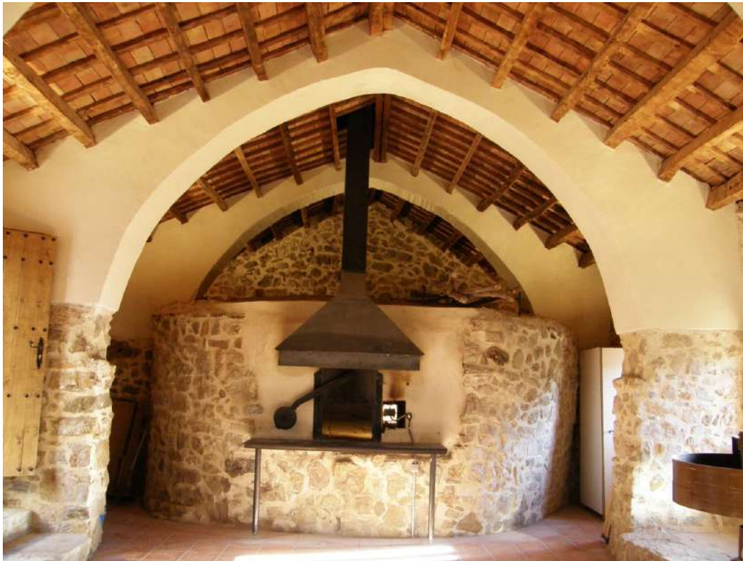
Aspecto del interior del horno, después de las obras de restauración llevadas a cabo entre 2005 y 2007