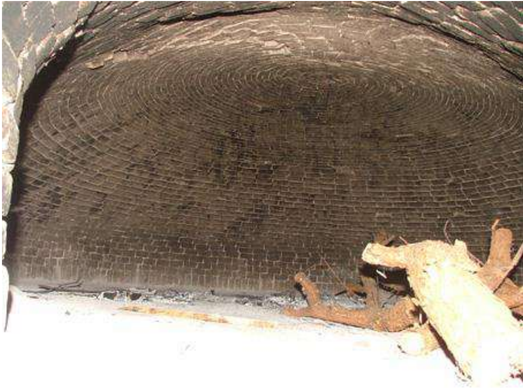
Detalles del acceso al horno desde la calle, piedra fechada en 1787 e interior del horno.