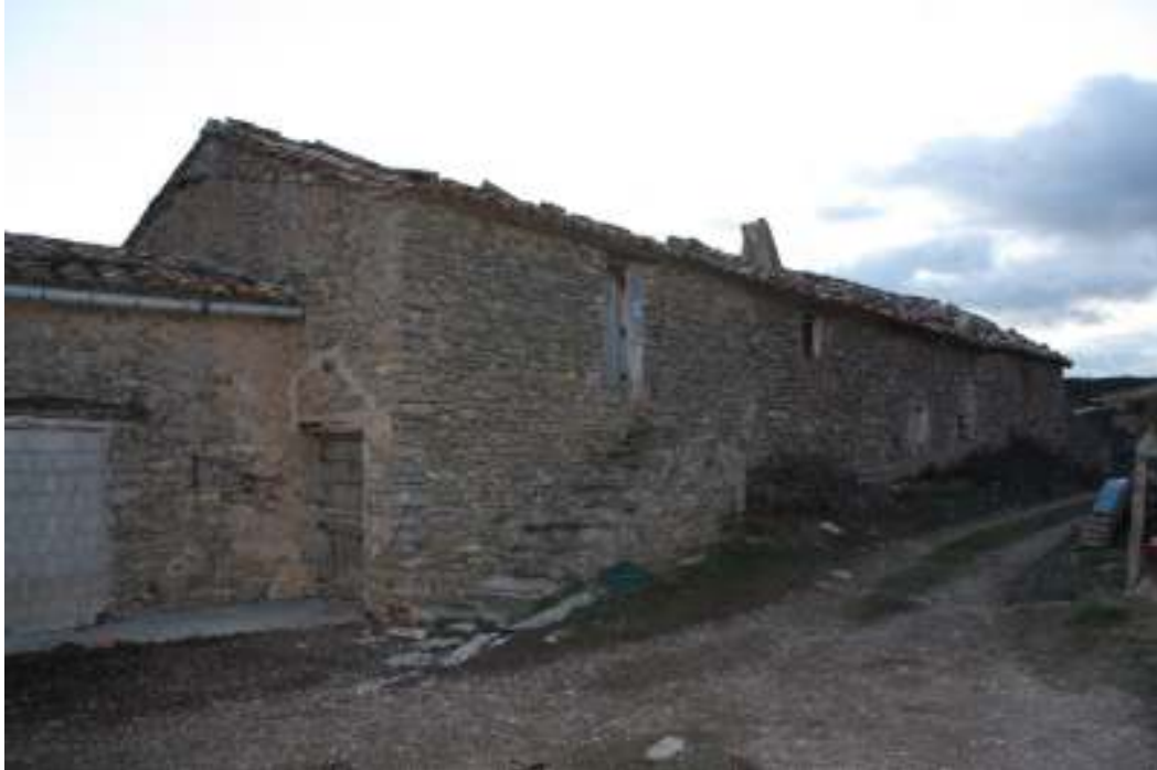
El Mas, vista parcial de su fachada principal.