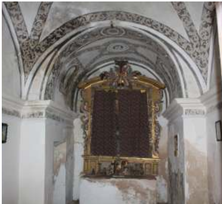
Interior de la capilla.