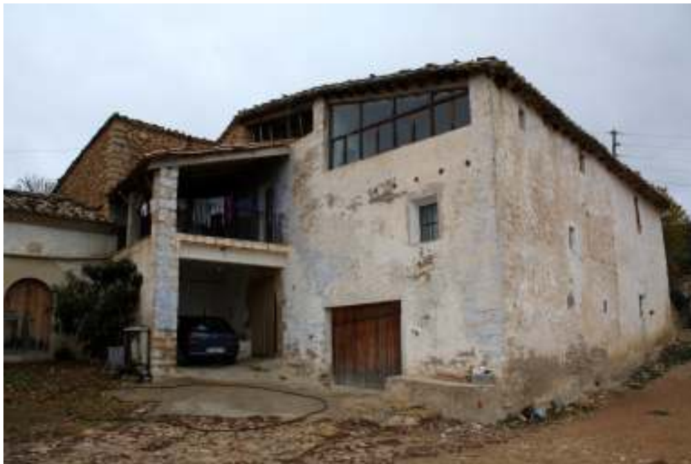
Vista del Mas.