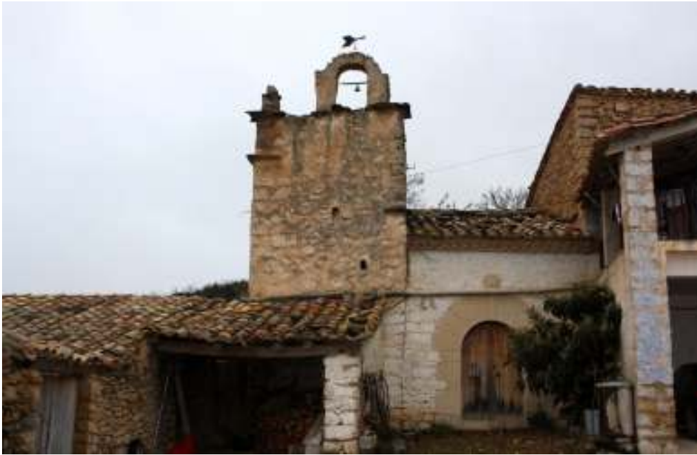
La Torre, ermita, capilla.