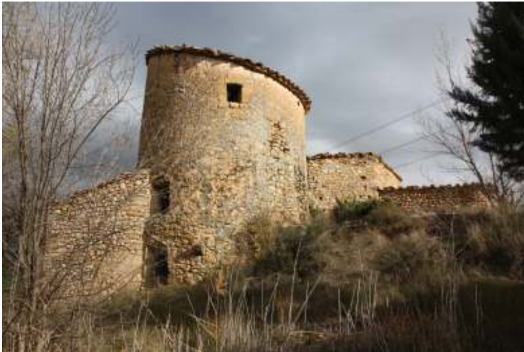
Vista del Molino.