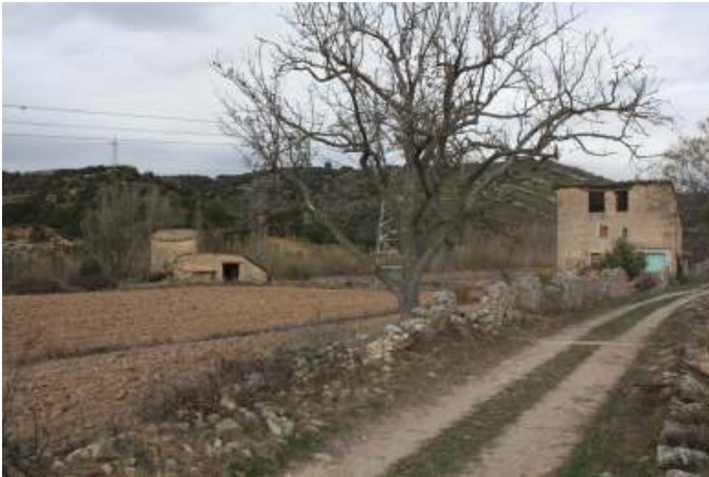
Vista en primer plano del Mas, en segundo, la Torre-Molino.