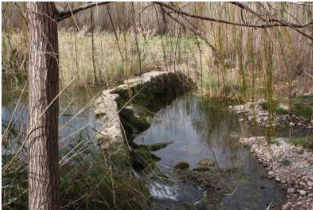
El azud junto al molino.