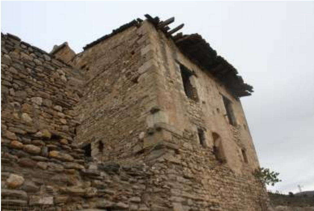
Diferentes vistas de la Torre.