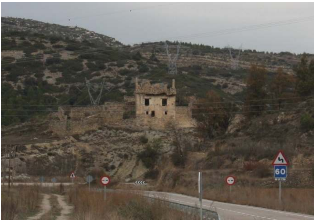
La Torre vista general.