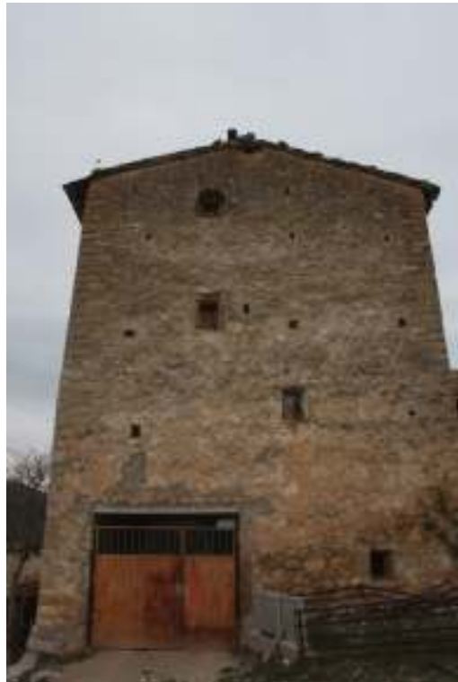
Vista de la Torre.