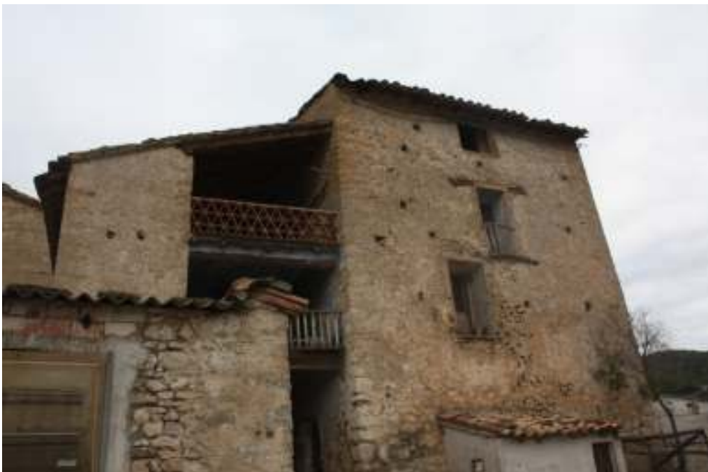
Detalle de la torre y edificio anexo.