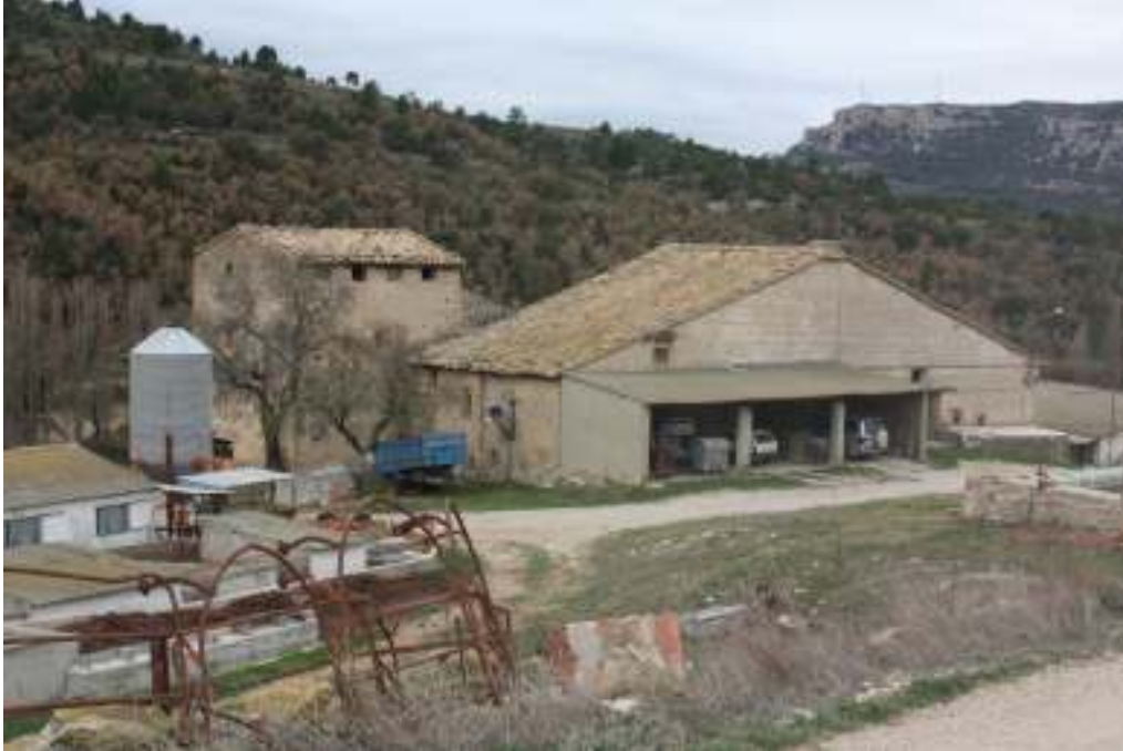
Vista del Mas.