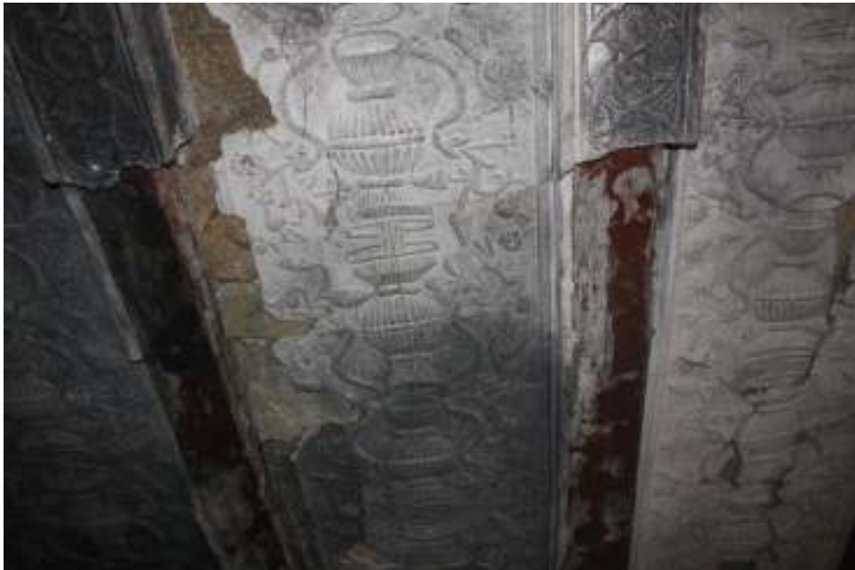
Cubierta del interior de la Torre.