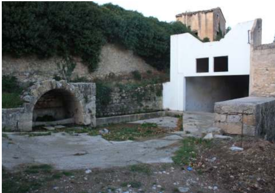
Entorno de la fuente.