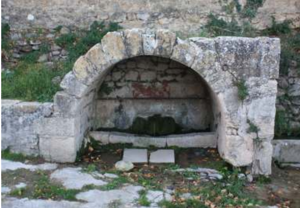
Vista de la fuente.