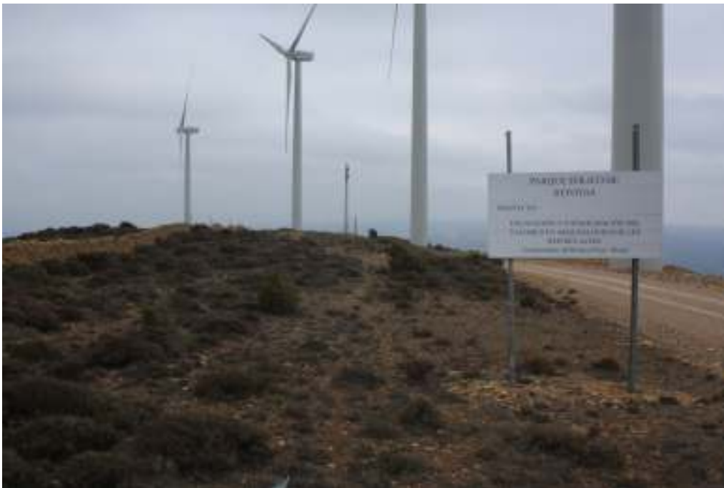
Diferentes vistas del yacimiento.