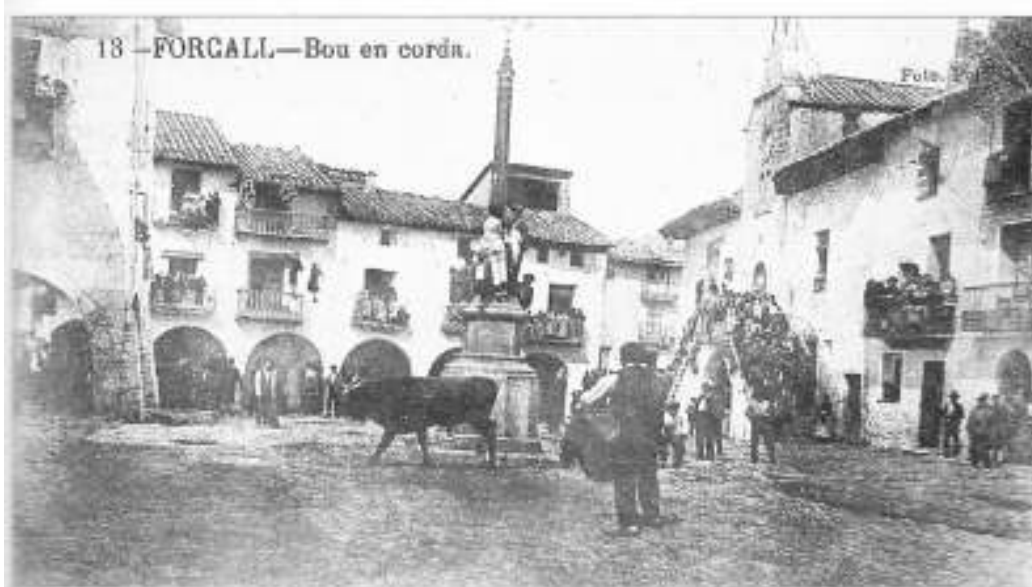
Vistas de la Plaça Major. La Plaça al siglo XIX con el "Peiró" nuevo. Foto de 1886. J. Polo.