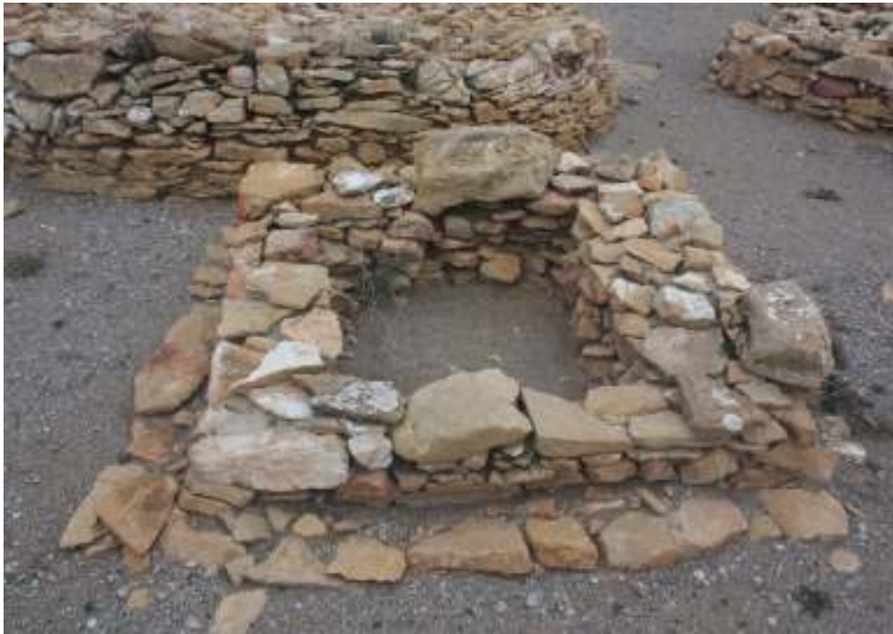
Detalle de túmulo de planta cuadrada.