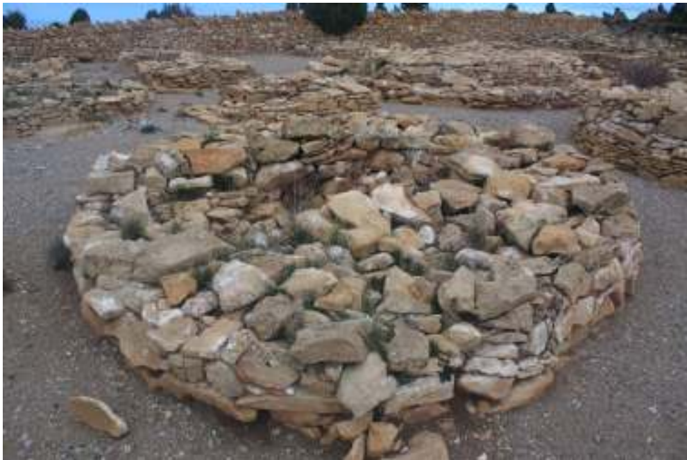
Detalle de túmulo de planta circular.