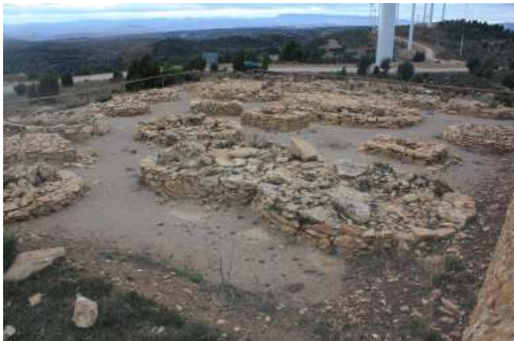
Vista general del complejo funerario.