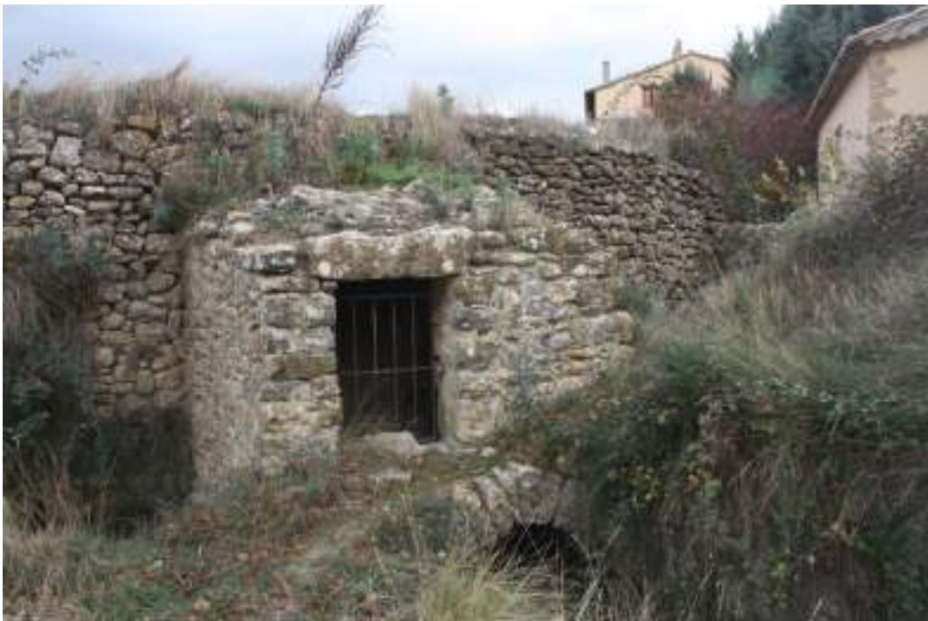
Vistas del Molí Matalí.