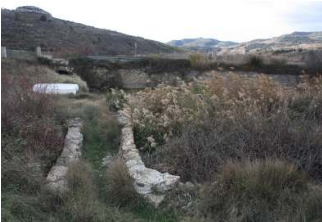
Vistas del puente.