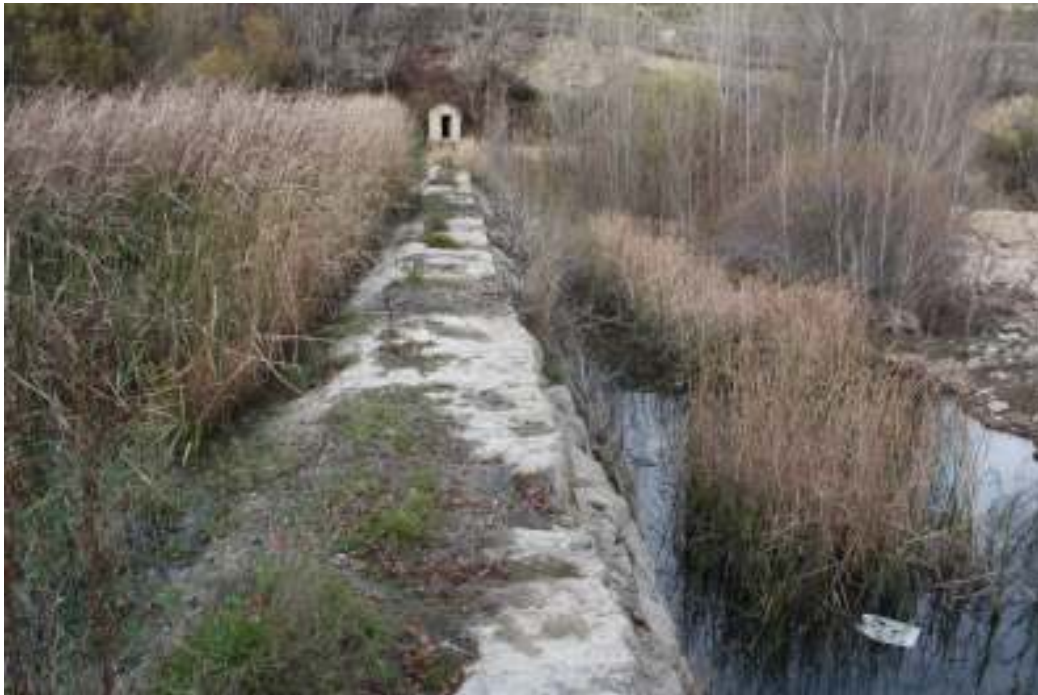
Vista del azud que atraviesa el río Cantavella.