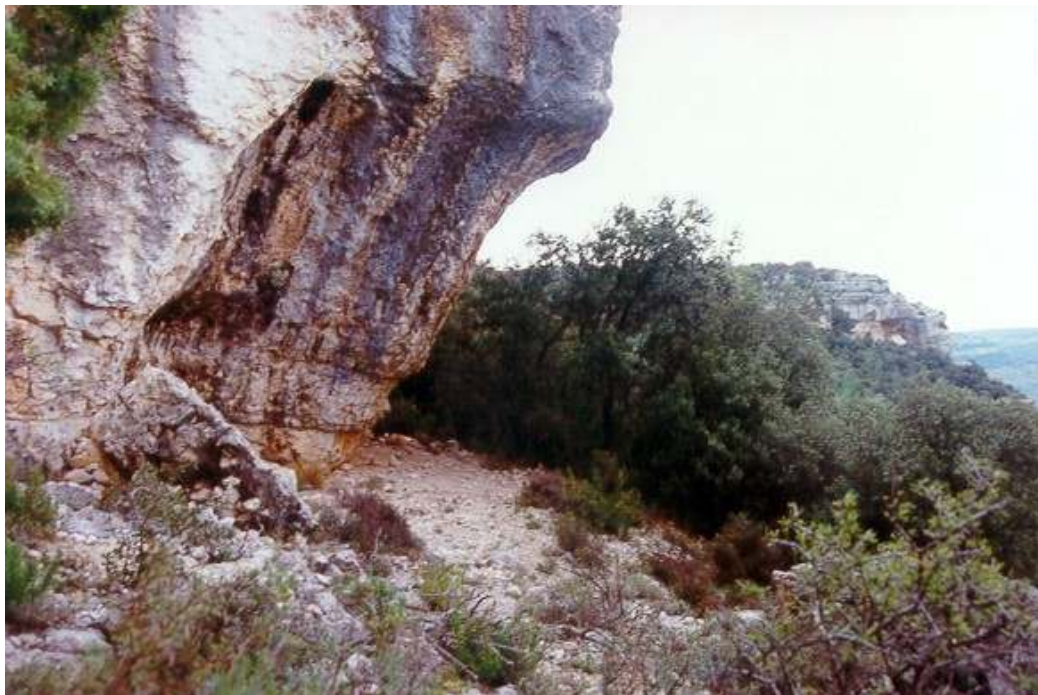
Área donde se extiende el material lítico y vista general del abrigo.