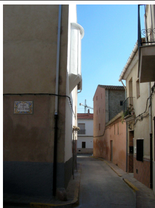
Calle Pere de Monsoriu