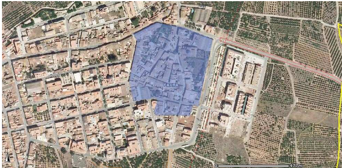
Fotografía aérea de localización