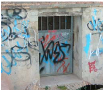
Fot. 19-e Carpintería