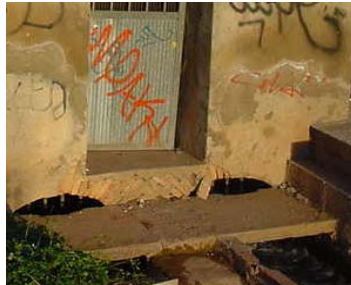
Fot. 19-f Pasarela acceso