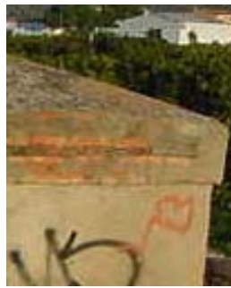
Fot. 19-b/19-c Textura y color recubrimiento