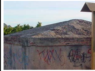
Fot. 19-d Cubierta