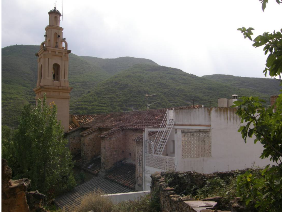
Imagen de la parte posterior del templo, con una edificación de tipo residencial y pobre factura arquitectónica, anexionada al edificio religioso.