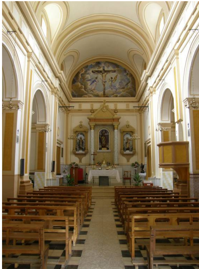
Aspecto del interior de la nave en la actualidad, donde se evidencia la colocación de un suelo inadecuado para este tipo de edificios y el tipo de decoración