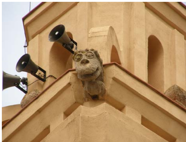
Detalle del campanario