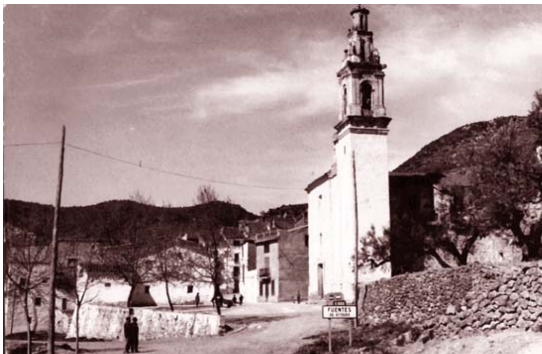
Imagen de la entrada al pueblo, dominada por el campanario de la iglesia, en la primera mitad del siglo XX