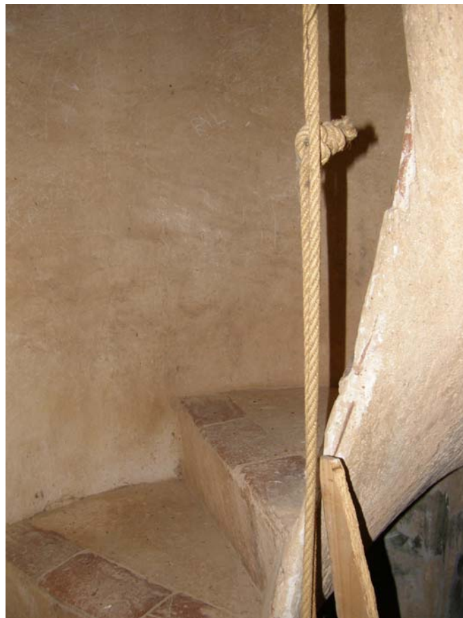
Detalle de la escalera de acceso al campanario, con una interesante bóveda helicoidal de ladrillo