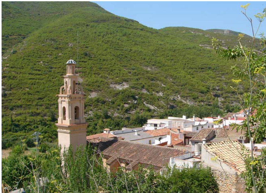
Aspecto actual de la iglesia de San Roque, con la fachada lesionada como consecuencia de la incorporación de tendidos aéreos y la aplicación de materiales impropios como recubrimiento. En la imagen inferior se aprecian también los daños provocados en el paisaje urbano como consecuencia de la ejecución de tejados ajenos a la arquitectura tradicional de la Sierra de Espadán.