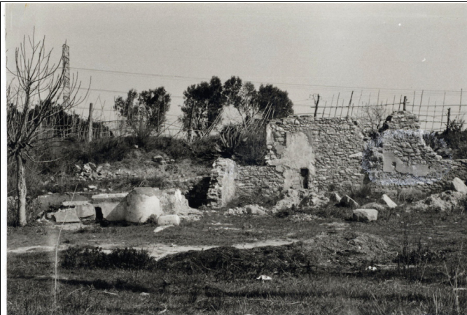
Ruinas del Molino del Vado.