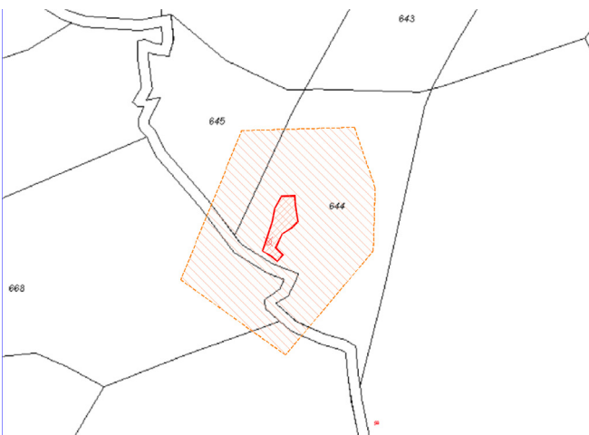
Yacimiento y propuesta de protección sobre catastro