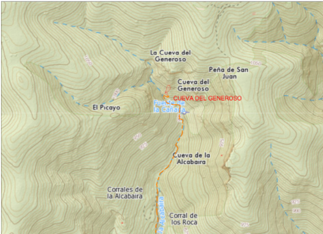
Situación y acceso