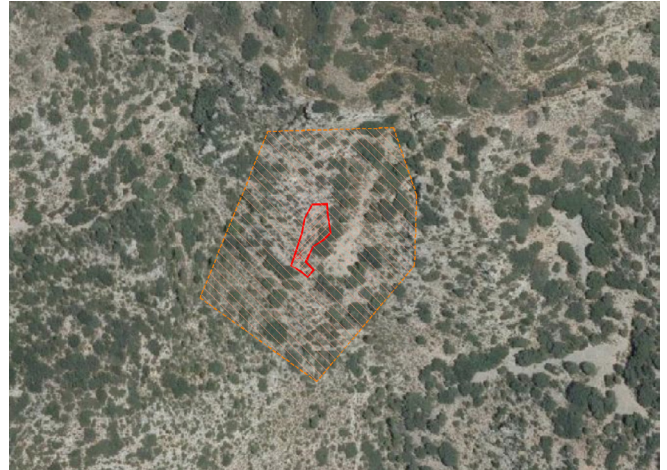
Yacimiento y propuesta de protección sobre orto