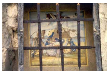
Imagen de la estación XIII