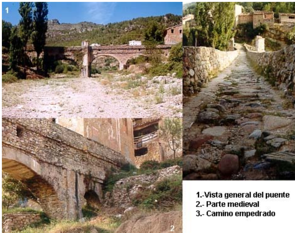
1.- Vista general del puente 2.- Parte medieval 3.- Camino empedrado