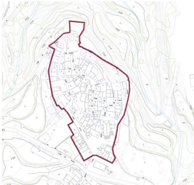
ENTORNO DE PROTECCIÓN

DELIMITACIÓN LITERAL \ DELIMITACIÓ LITERAL