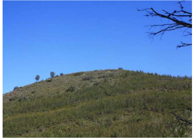
Diferentes panorámicas del alto de San Cristobal.