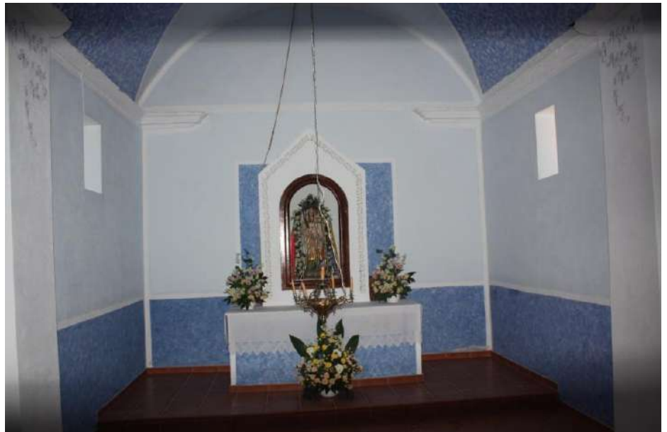
Vistas del exterior y del interior de la Ermita.