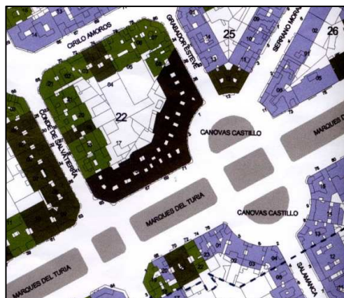
PEP-1 Ensanche Pla Remei – Russafa Nord