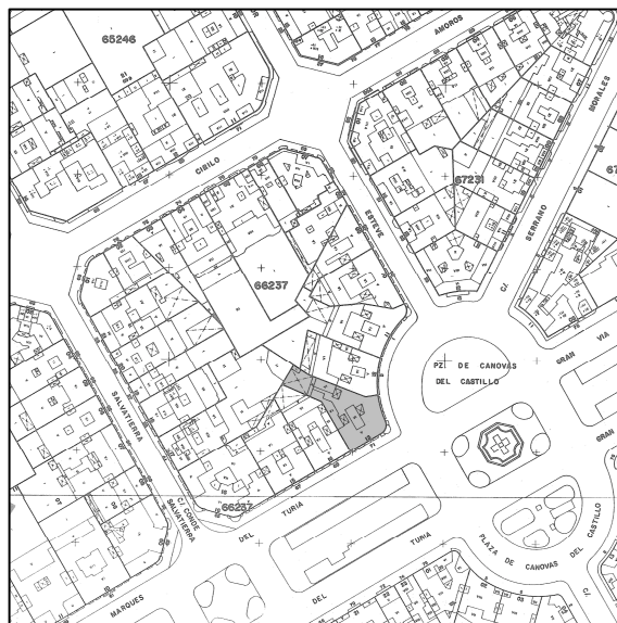
Cartografía C.G.C.C.T. 1980