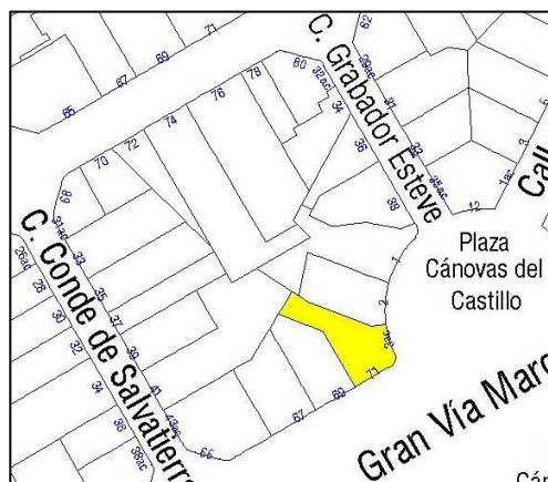
Parcelario Municipal 2009 SIGESPA