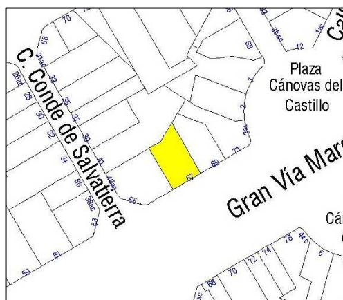
Parcelario Municipal 2009 SIGESPA

NUMERO DE EDIFICIOS: 1 NUMERO DE PLANTAS: 1/5 OCUPACION: TOTAL CONSERVACION: BUENO