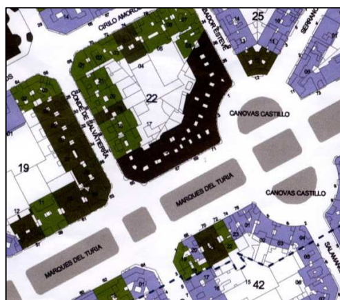
PEP-1 Ensanche Pla Remei – Russafa Nord

PLANEAMIENTO: PEP-1 Ensanche Pla Remei – Russafa Nord (BOP 26.02.2005) HOJA PLAN GENERAL: 35 CLASE DE SUELO: SU CALIFICACION: Ensanche Protegido (ENS-2L) USO: PROTECCION ANTERIOR: BRL (26.02.05) OTROS: Nº Archivo PE 1653