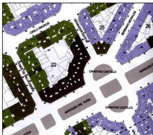
PEP-1 Ensanche Pla Remei – Russafa Nord

PLANEAMIENTO: PEP-1 Ensanche Pla Remei – Russafa Nord (BOP 26.02.2005) HOJA PLAN GENERAL: 35 CLASE DE SUELO: SU CALIFICACION: Ensanche Protegido (ENS-2L) USO: PROTECCION ANTERIOR: BRL (26.02.2005) OTROS: Nº Archivo PE 1653