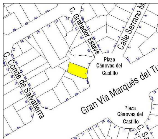
Parcelario Municipal 2009 SIGESPA

NUMERO DE EDIFICIOS: 1 NUMERO DE PLANTAS: 6 OCUPACION: TOTAL CONSERVACION: BUENO