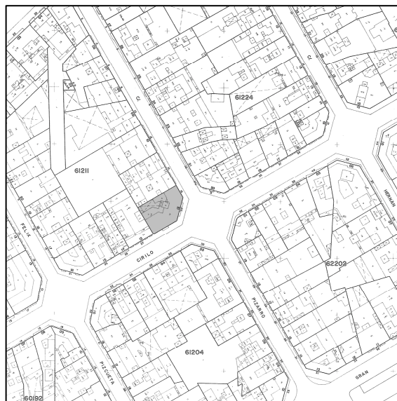
Cartográfico C.G.C.C.T. 1980