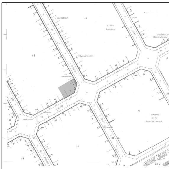
Cartográfico Municipal 1929 - 1945