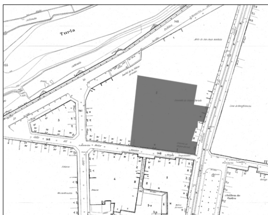
Cartográfico Municipal 1929-1945