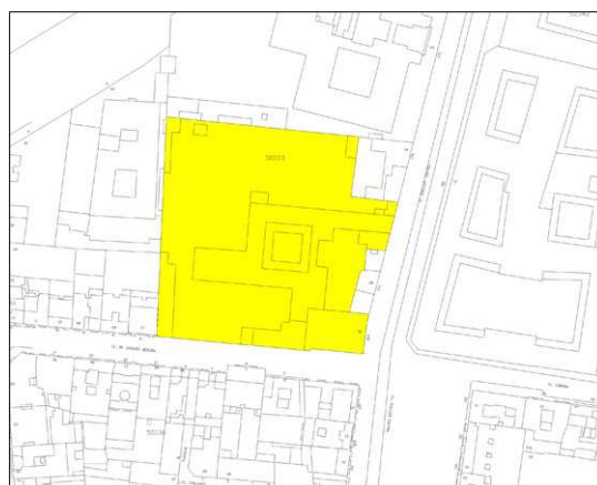
Plano catastral 2009