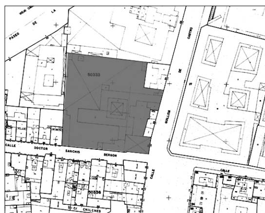
Cartográfico C.G.C.T 1980