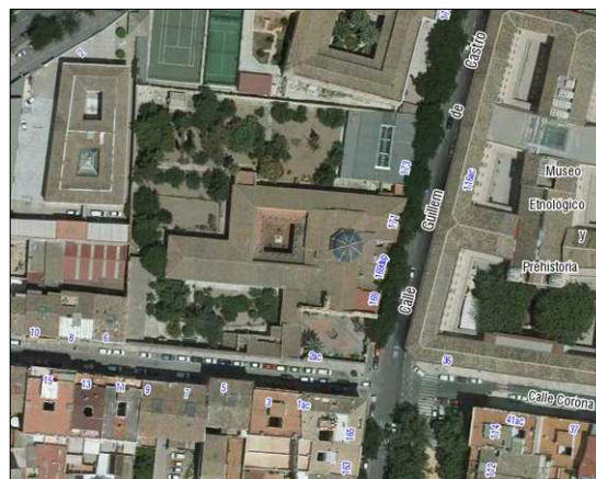
Fotografía Aérea 2008

SUPERFICIE: TOTAL: 6188,03 M2 Convento: 2127,72 M2