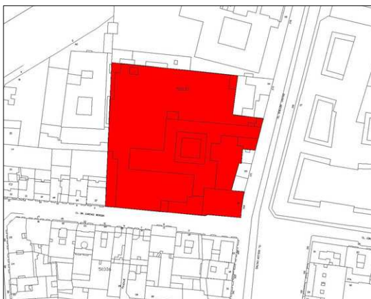
Entorno de protección. Identificación de los elementos protegidos