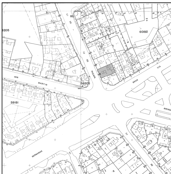
Cartográfico C.G.C.C.T. 1980