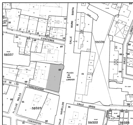
Cartográfico C.G.C.C.T 1980