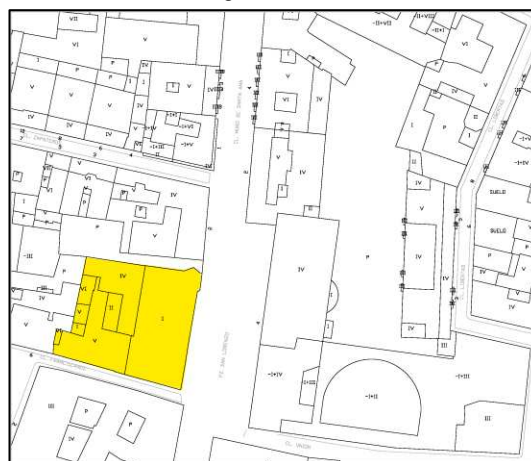
Plano Catastral 2009

NÚMERO DE EDIFICIOS: 1 NÚMERO DE PLANTAS: 1 OCUPACIÓN: TOTAL CONSERVACIÓN: REGULAR