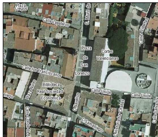
Fotografía Aérea 2008

Cartografía Catastral: YJ2753D Manzana: 58337 Parcela: 08 (parte) CART. CATASTRAL IMPLANTACIÓN: EN ESQUINA FORMA: REGULAR SUPERFICIE: 855.32 M2