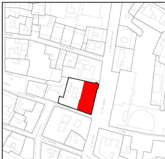
Entorno de protección. Identificación de los elementos protegidos