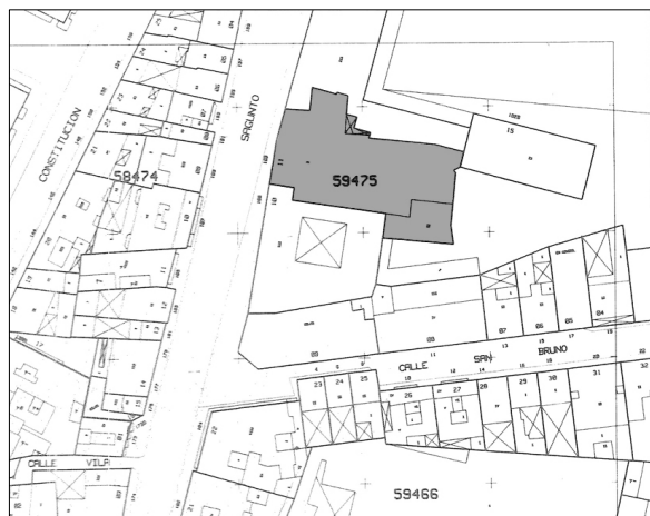
Cartográfico C.G.C.C.T 1980