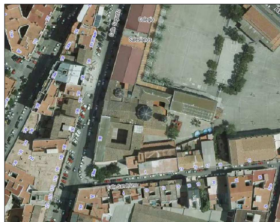
Fotografía Aérea 2008