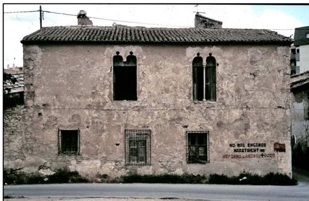
Vista Lateral de la Alquería del Moro