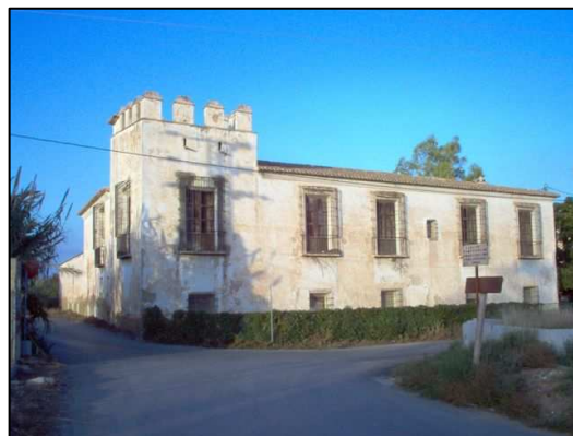
Fachada de la Alquería de la Torre recayente a la Calle Alquería del Moro