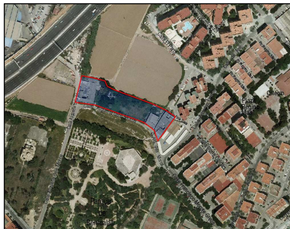
Foto aérea 2008 SIGESPA con ámbito arqueológico propuesto

Coordenadas UTM: X: 723.980,81 Y: 4.375.642,75 (Ver anexo parcelas catastrales) CART. CATASTRAL 378-19-IV / 20-III SUPERFICIE: 7114,48 M2