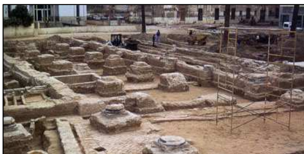
Vista de la Iglesia del antiguo Hospital General