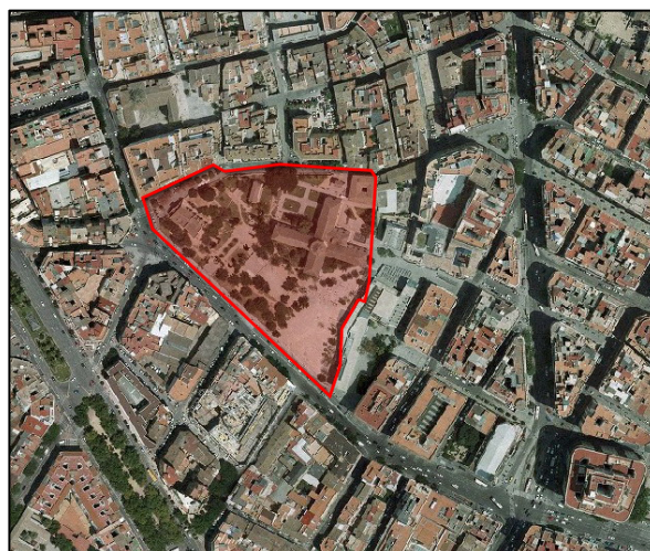
Foto aérea 2008 SIGESPA con ámbito arqueológico propuesto

Coordenadas UTM: X = 725.295,96 Y = 4.372.454,03 (Ver anexo parcelas catastrales) CART. CATASTRAL: 401-21-III / 423-1-I SUPERFICIE: 21.943,29 M 2