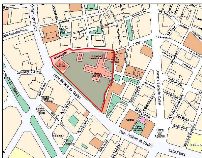
Planeamiento vigente SIGESPA con ámbito arqueológico propuesto