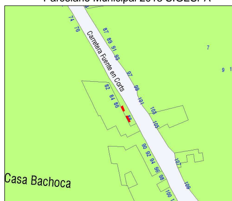
Planeamiento vigente SIGESPA