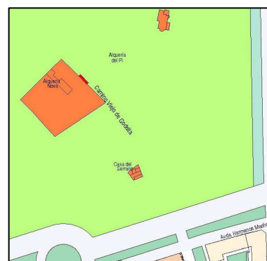
Planeamiento vigente SIGESPA

PLANEAMIENTO: PGOU (BOE 14/01/1989) HOJA PLAN GENERAL: 17 CLASE DE SUELO: SNU CALIFICACION: USO: SIN USO PROTECCION ANTERIOR: OTROS: Corrección de Errores: DOGV 03.05.1993