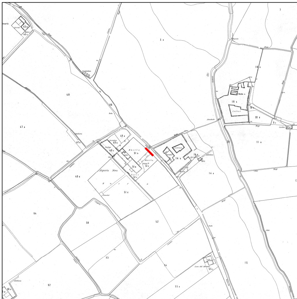
Cartográfico Municipal 1929-1945

San José se encuentra semiarrodillado sobre una nube peana flanqueado por dos angelitos. Firmado en el ángulo inferior derecho al Niño Jesús y con la mano derecha portador de una pequeña cruz. Sobre ellos el resplandor y la paloma símbolo del Espíritu Santo. El angelito situado a su izquierda tiene en la mano la barra florida, el atributo de San José y el otro angelito, a su derecha, la filatería. Todo el grupo esta cobijado por una hornacina ficticia formada por un arco de medio punto y dos columnas Jónicas. Tiene otra orla exterior rectilínea decorada con botones, hojas y un rallado paralelo azul y marrón. En la parte superior central pone "AÑO 1940", y en la parte inferior otra carlela con "SAN JOSEP". (1)